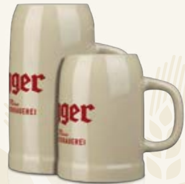
Egger Tonkrüge 1 L + 0,5 L