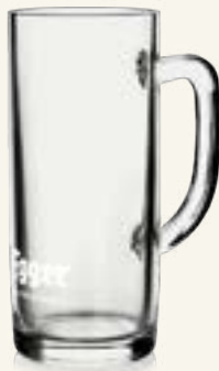
Egger Krug 0,3 L