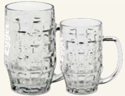
Egger Festkrüge 0,5 L + 0,3 L