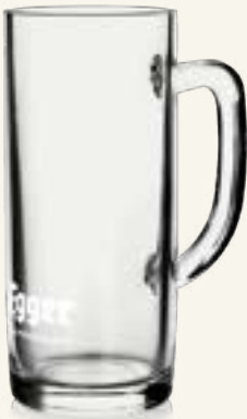
Egger Krug 0,5 L