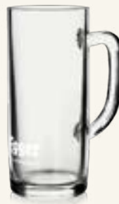
Egger Krug 0,2 L