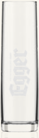
Trendline Glas 0,5 L